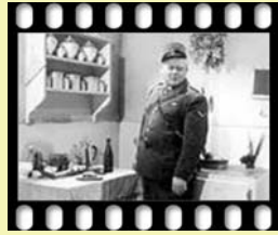
Charles Chaplin Dances with Wolves Polizischt Wäckerli The longest Day Indiana Jones