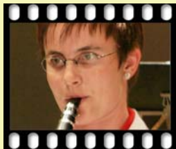
Indiana Jones Dances with Wolves Polizischt Wäckerli Filmmusik Die Brücke am Kwai