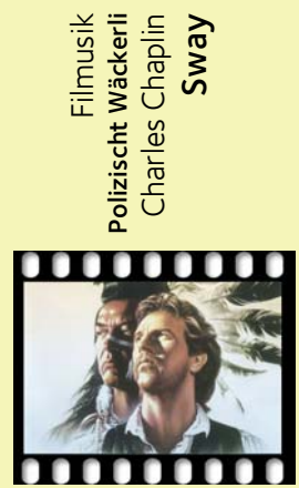
Filmmusik Polizischt Wäckerli Charles Chaplin Sway